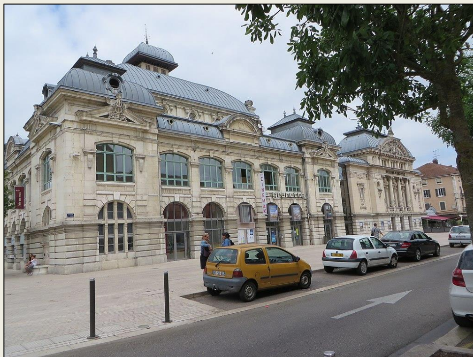
Le théâtre de Bourg-en-Bresse construit entre 1895 et 1899