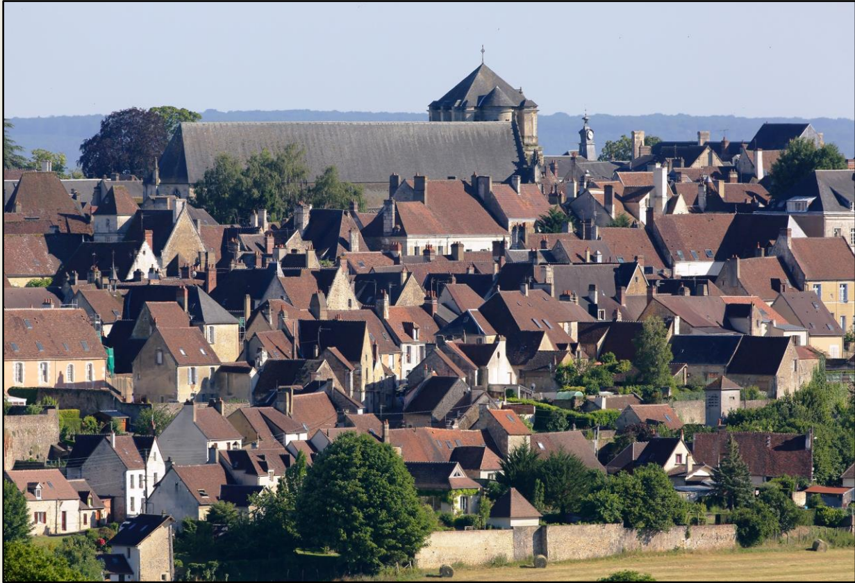
La ville de Mortagne-au-Perche, capitale du Perche