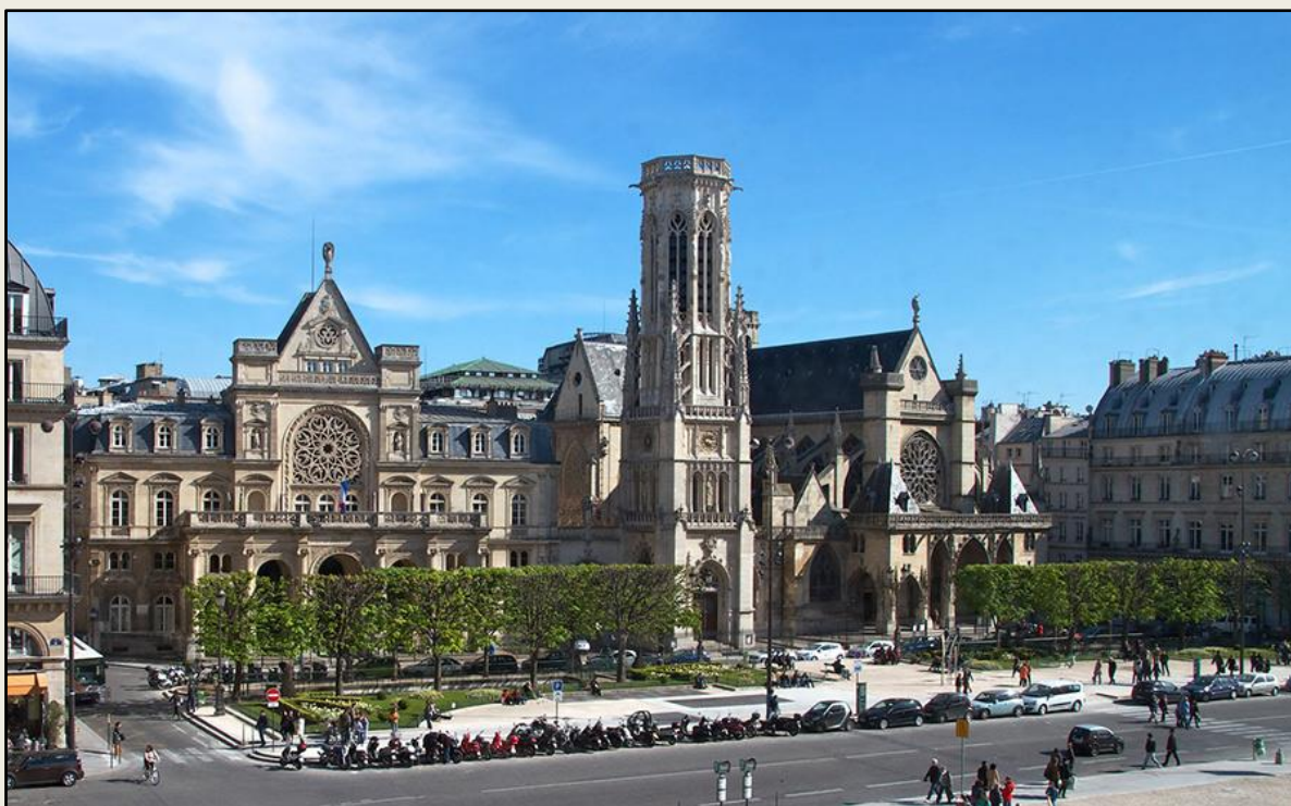
L'église Saint-Germain-l'Auxerrois de Paris