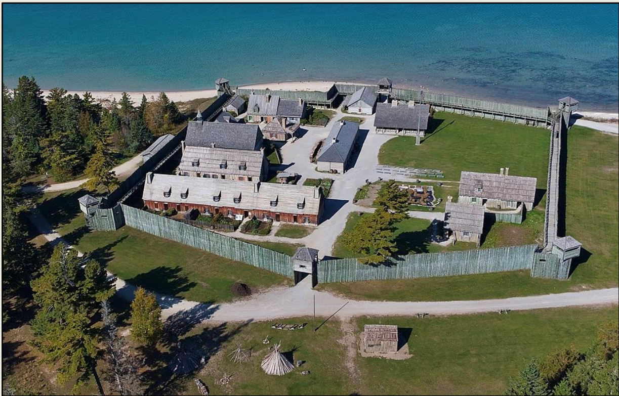
Le fort Michilimakinac aux États-Unis